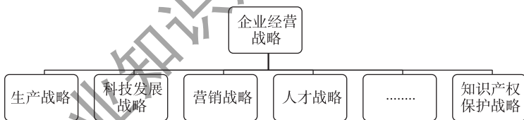
图1 知识产权保护战略是企业经验战略的组成部分

企业经营战略包含各类型业务战略，比如生产战略、科技发展战略、营销战略、人才战略等，也应包含知识产权保护战略，如图1所示。